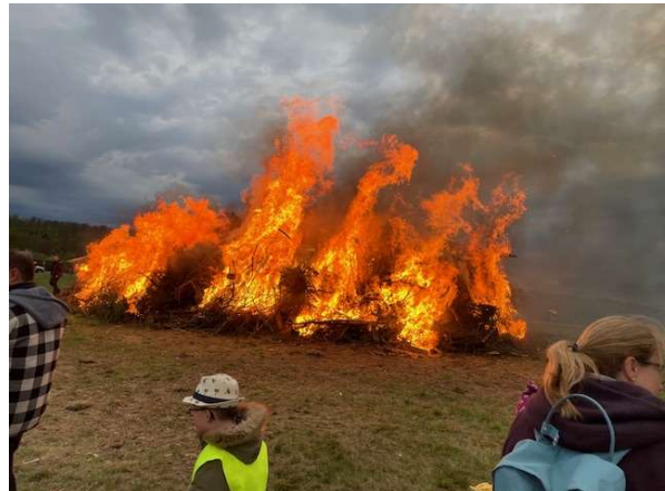
Am Ostersonntag wird das Osterfeuer am Heideweg entzündet, organisiert von der KJC.