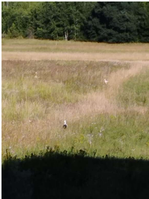
Störche bei alternativer Futtersuche