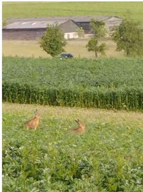
Feldhasen beim Frühstück