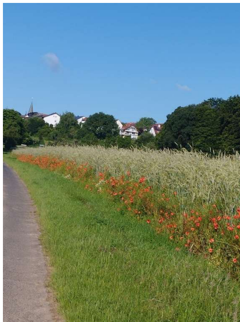
Eine Augenweide am Kirscheknäpperweg